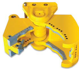
Stanzgebiss C mâchoires à béton C