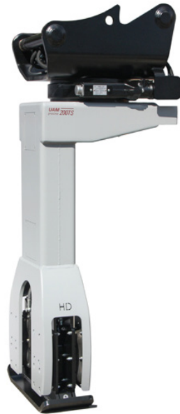
HD 200 TS/TL