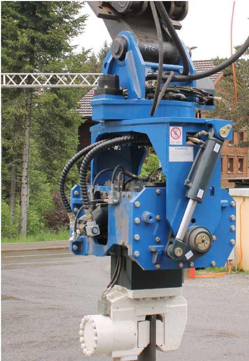
Klemmzange Pince standard

Innenbreite H-Träger >180mm Largeur intérieure profil H >180mm