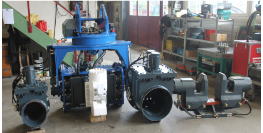
Für Holzpfähle Poteaux en bois

Innenbreite H-Träger >180mm Largeur intérieure profil H >180mm